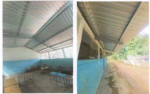
Foto 4: MEJORAMIENTO DE TECHO A LÁMINA TROQUELADA CALIBRE 26 Y MEJORA DE ESTRUCTURA PORTANTE A METALICA

Observación: Si es necesario se pueden agregar hojas adicionales y actualizar el número de hojas.